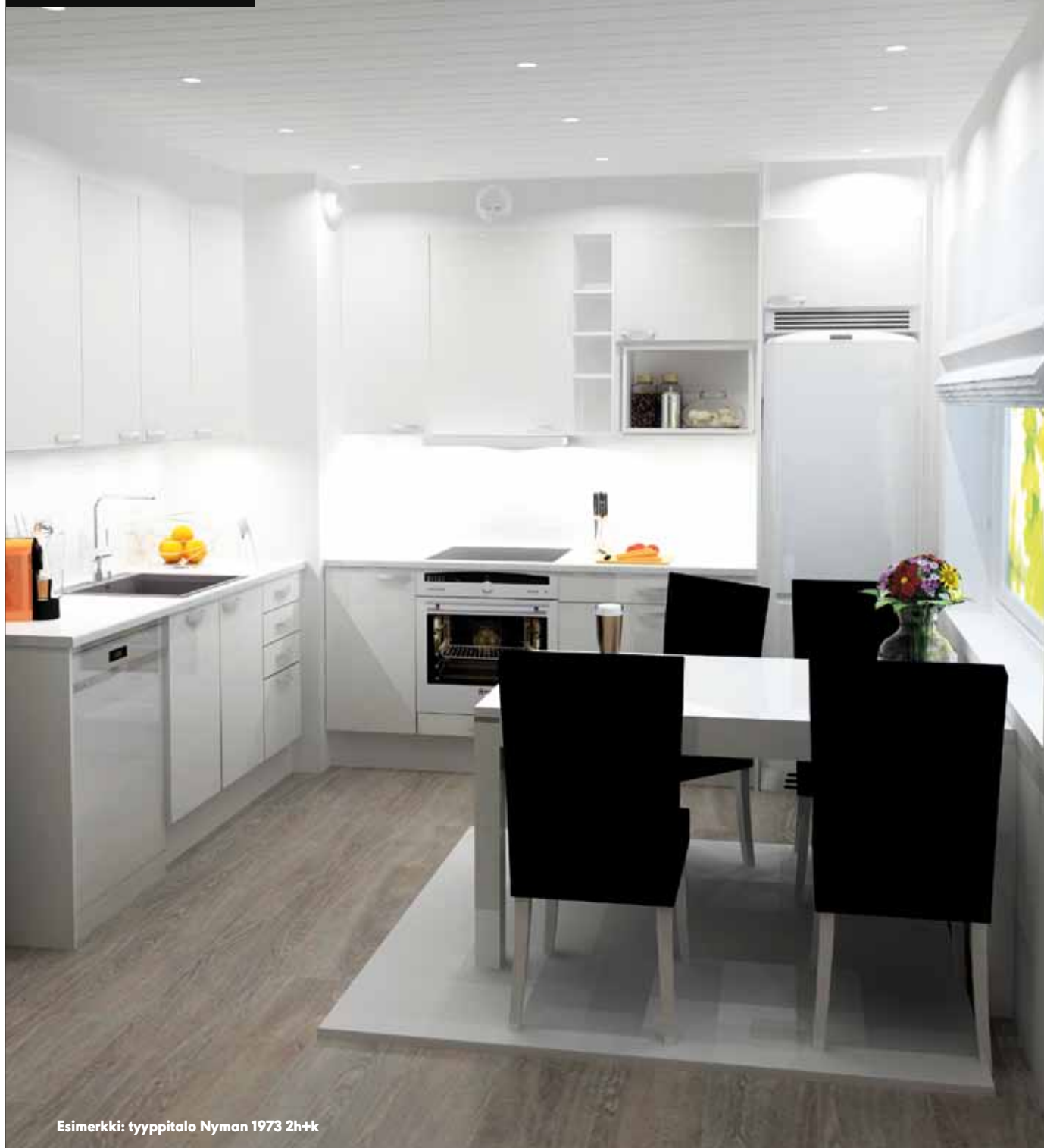
Esimerkki: tyypitalo Nyman 1973 2h+k